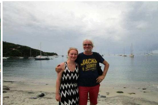
Unseren Nachttörn gut überstanden!

Am nächsten Tag ist das Bord-WC verstopft, keine Fehlbedienung, der Abflussschlauch ist total verkalkt. Das konnten wir bei der Übernahme natürlich nicht sehen. Rohr ausbauen, an Land fahren und die Kalkverkrustungen durch Schlagen mit und auf Steinen lösen und danach alles wieder zusammenbauen.