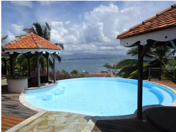
Villa mit Blick auf Fort de France

Dann segeln wir, man kann es nicht glauben, die 5,4 Meilen zur Bucht Grand Anse raumschot. Das erste Mal in unseren Urlaub Raumschot-Kurs!