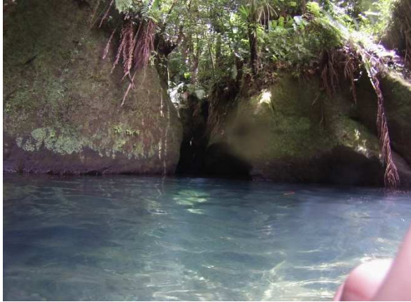
Der Eingang zur Unterwelt