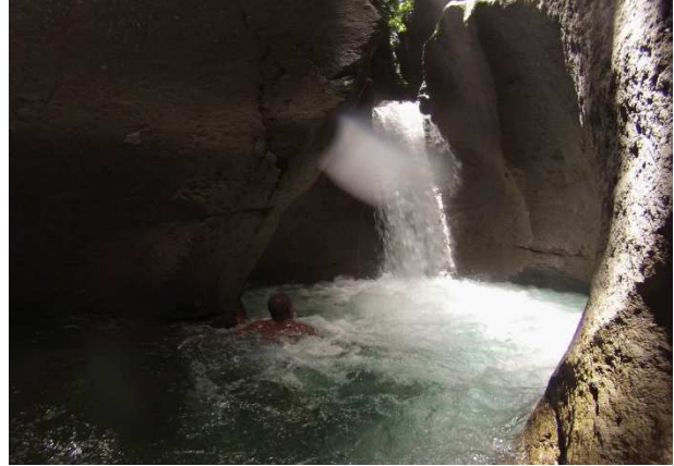
In der Unterwelt