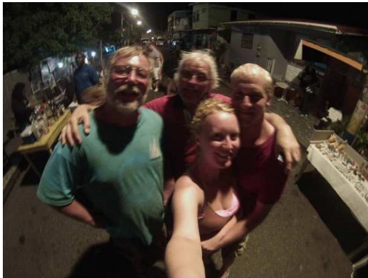
Freitagnacht Jump up auf St. Lucia

Wunderschöne Tage auf St. Lucia mit einem 2-Tagesausflug auf der LaRossa zu den Pitons und Übernachtung in der Marigot Bay lassen die Zeit bei tropischen Temperaturen verdunsten.