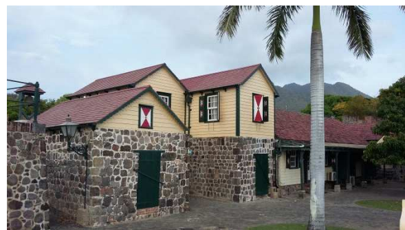
Villa des niederländischen Gouverneur