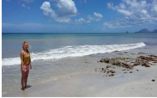
Saint Anne im Süden von Martinique