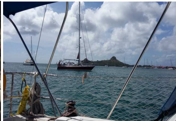
SY LaRossa in der Rodney Bay vor Pigeon Island

Unser angedachtes Ziel Grenada haben wir uns für einen der nächsten Törns auf und genießen das Easy Living und das „Chillen am Limit“.