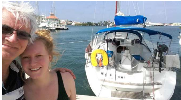
Das ist unsere „Bleibe“ für fünf Wochen.

Der nächste Tag ist für die Übergabe und die Einkäufe geplant, für Sonntag steht die Inselerkundung mit öffentlichen Verkehrsmitteln auf dem Programm.