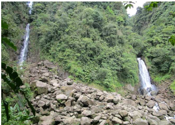
Besuch bei Mama und Papa (links Papa)