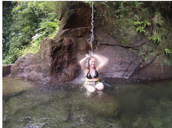
Warme Naturdusche am Ausgang der Höhle