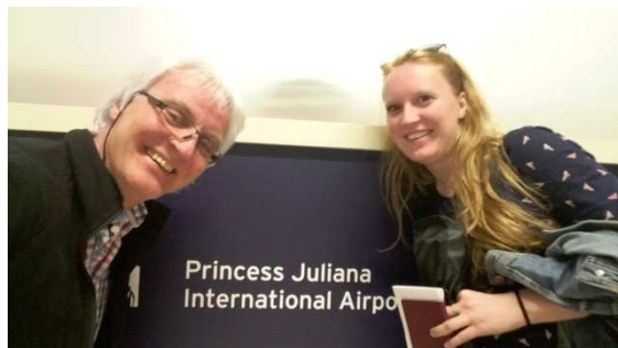
Wir können es kaum erwarten!

Kaum haben wir den Airport verlassen, wird uns von einer netten Dame ein Taxi zugewiesen, die auch gleich dem Taxifahrer unser Ziel nennt, perfekt. Leider missverstehen sich die Beiden und die Fahrt führt uns quer über die Insel zum falschen Hafen. So gibt es die erste Inselerkundung kostenfrei. Wir haben doch 5 Wochen Zeit.