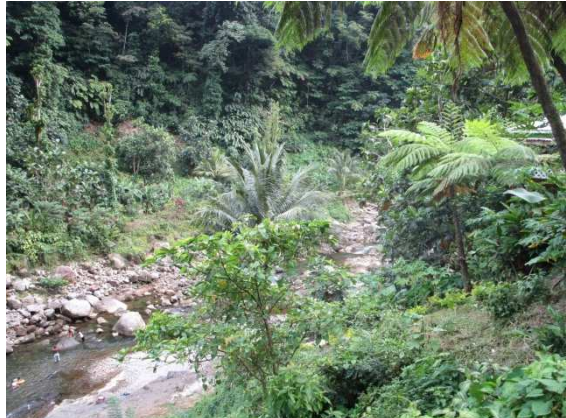
das ursprüngliche Dominica