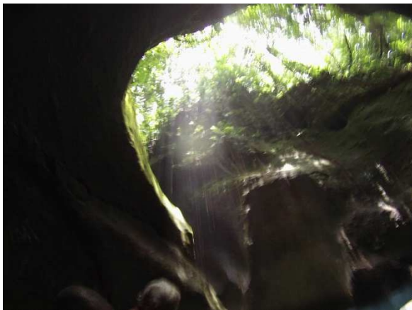
Blick in den tropischen Himmel