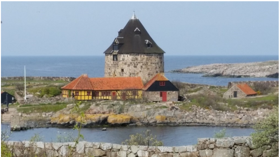
Impressionen Christiansö und Frederiksö